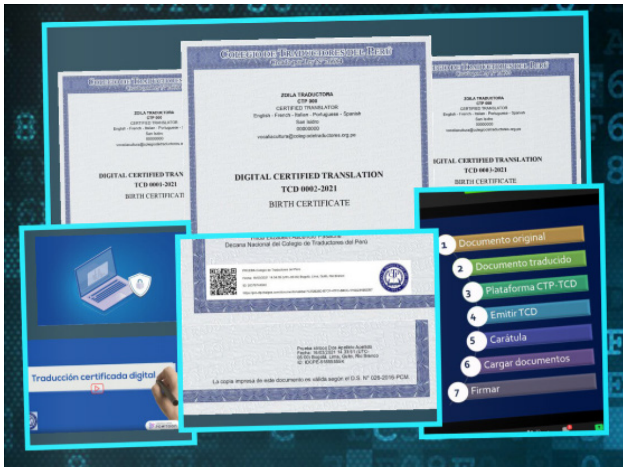
Crédito: Carátula del Boletín Traduciendo n.º 13 del CTP