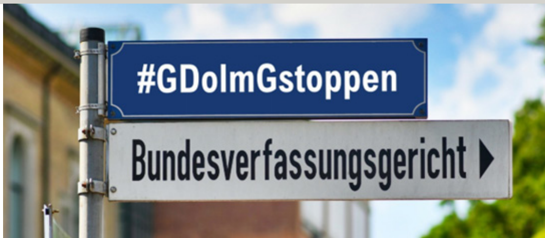
De camino al Tribunal Constitucional Federal de Alemania

Por desgracia, la sensatez de este objetivo colisionó con la naturaleza defectuosa del proceso legislativo resultante y de la propia GDolmG. Contrariamente a la práctica habitual, el Ministerio ignoró los comentarios de las partes interesadas, y la Sra. Lambrecht no permitió debates en torno a las críticas expresadas por las asociaciones profesionales ni garantizó una preparación exhaustiva antes de promulgar el proyecto de ley. Cuando este llegó a la segunda cámara parlamentaria